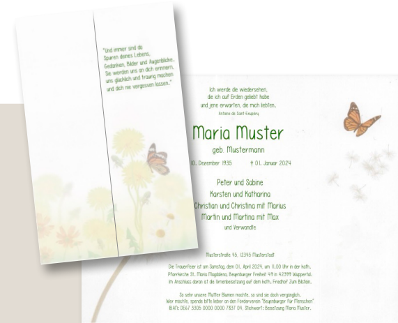
Faltkarte mit Altarfalz

Traueranschrift: Fam. Mustermann, Musterstraße 1, 12345 Musterstadt Die Trauerfeier mit anschließender Beisetzung ist am Donnerstag, den 2. April 2024, um 10.00 Uhr auf dem ev. Friedhof Lüttringhausen, Schmittenbuscher Str., in 42899 Remscheid. Im Anschluss daran laden wir herzlich zum Kaffeetrinken in das Hotel-Restaurant Fischer, Lüttringhauser Str. 131 in 42899 Remscheid ein. So sehr wir Blumen mögen, so sind sie doch vergänglich. Wer möchte spende lieber einen Beitrag an das Zentrum für Konduktive Förderung. Stichwort: Beisetzung Mustermann, Sparkasse Gladbeck, IBAN: DE35 4245 0000 0668 86. Weitere Informationen unter: www.zentrum-konduktive-forderung.de